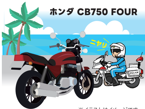
※イラストはイメージです。