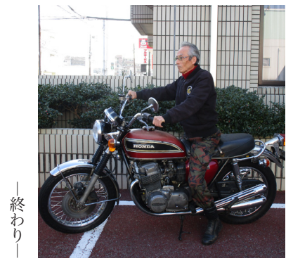
— 終わり —