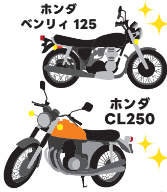
※イラストはイメージです。

単車とはバイクのことで、近頃あまり使われない言葉である。私は現役の単車乗りで愛車はホンダCB750、俗にCBナナハンと呼ばれる。まずは、この愛車との出会いも含めた私の単車遍歴を述べます。